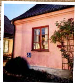
Bullar med smör och kärlek på Nolbygårds Ekobageri i Alingsås.

☛ I fikastaden Alingsås börjar kafévandringen redan vid tågstationen. Eller vid späd ålder om man har turen att födas här. I Alingsås går lokala bebisar nämligen direkt från amning till fika med dopp: det vimlar av blommiga kaffekoppar, bakelser och kanelbullar. Vart och vartannat pastelligt trähus med innergård är ett topprankat kafé: Nygrens, Ekstedts och Nolbygårds Ekobageri till exempel. Sedan sover vi gott på stilig Grand Hotel Alingsås. Självklart ordnar hotellet fika för den som inte fått nog under dagen. Grandhotelalingsas.se