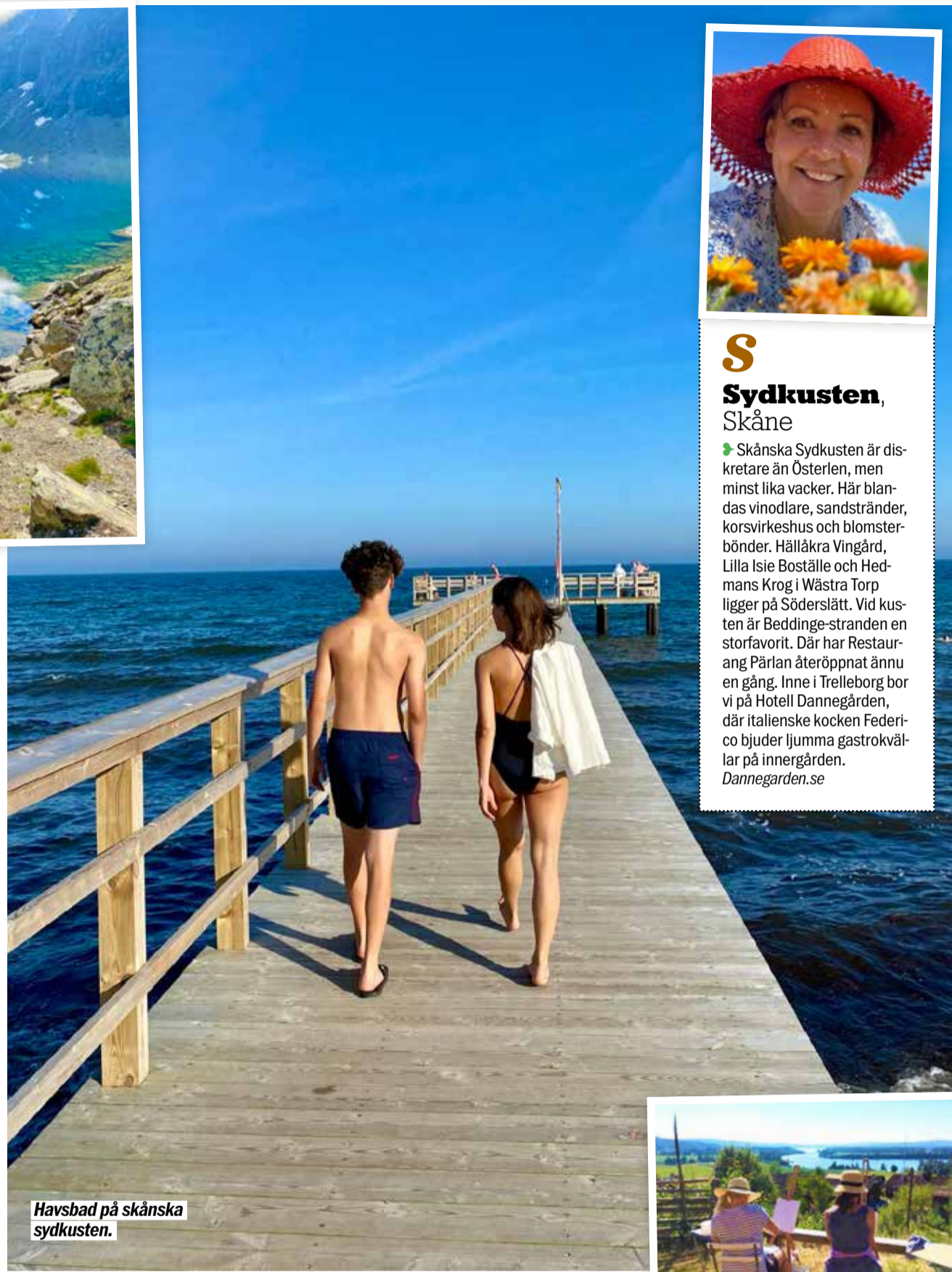
Havsbad på skånska sydkusten.

Ett stenkast från Rydebäck strand ligger ett nyöppnat spa-hotell för vuxna: Hotel 1622. Byggnaden är en del av Rydebäcksgård, klädd i handslaget tegel. De 34 designrummen har frilagda bjälkar och Mallorciska textilier. Restaurang Tegel serverar lokalt rotad mat under antika valv. Men allra bäst är spa:t, lyxigt och genialiskt färgsatt. Hotell1622.se