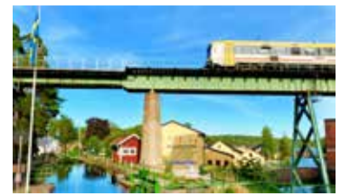
Vandrarhemmet Upperud 9:9.